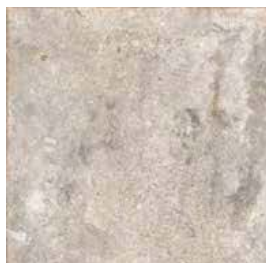
Queens Blanco 50 x 50 cm