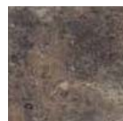
Queens Negro 25 x 25 cm