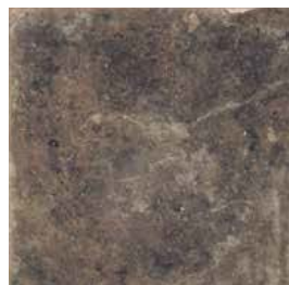
Queens Negro 50 x 50 cm