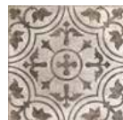
Queens Decor Flor 25 x 25 cm