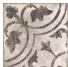
Queens Decor 25 x 25 cm