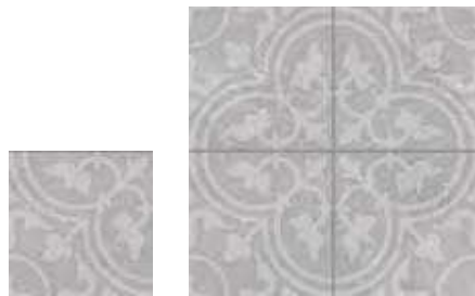
1897 Forja Gris