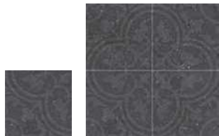
1897 Forja Antracita