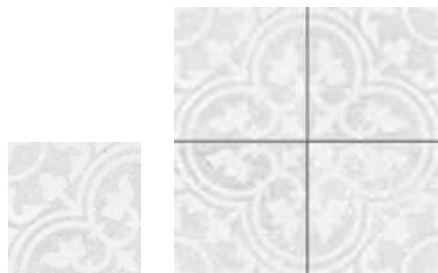
1897 Forja Perla