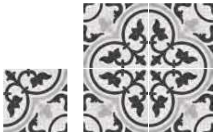
1897 Forja Mix